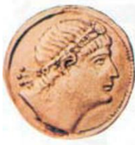
Ο Κωνσταντίνος σε νόμισμα της εποχής