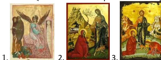
1. 2. 3.

Η εικόνα της Αναστάσεως στην Ορθόδοξη Εκκλησία έχει δύο τύπους: Ο ένας είναι η κάθοδος του Χριστού στον Άδη, η «Άδου Κάθοδος» και ο δεύτερος εικονογραφικός τύπος είναι εκείνος που εικονίζει άλλοτε τον Πέτρο και τον Ιωάννη στο κενό Μνημείο και άλλοτε τον