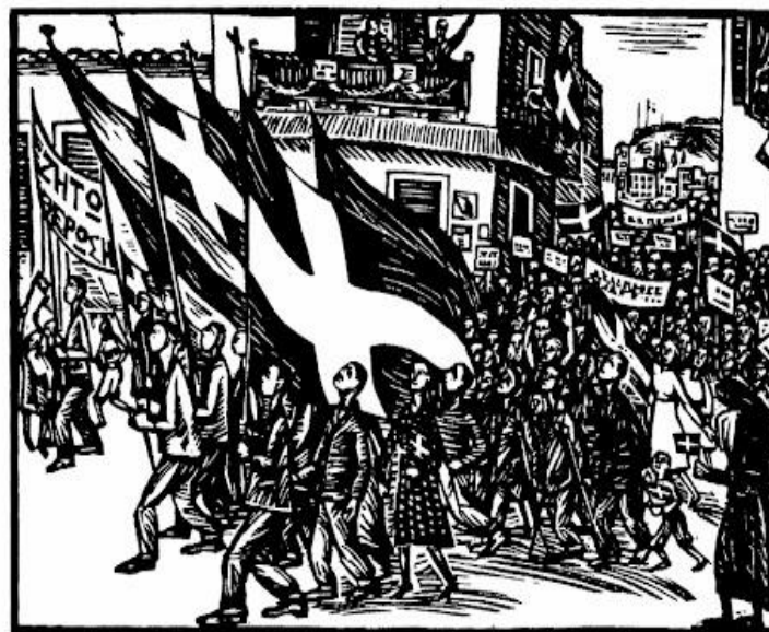
Απελευθέρωση της Αθήνας, ξυλογραφία της Βάσως Κατράκη (1944)